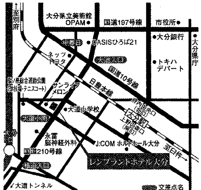
ホテル近郊ガイドマップ Guide map in the neighbourhood of the REMBRANDT HOTEL OITA