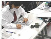
高森高校マンガ学科 オリジナル作品展示