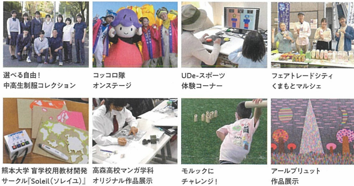
選べる自由! 中高生制服コレクション

熊本県では、一人一人を大切に作る熊本づくりをめざし、人権に関するさまざまな広報啓発活動を行っています。その一環として、県民の皆さまに人権を身近に感じていただくため、人権フェスティバルを開催します。