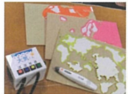
熊本大学 盲学校用教材開発 サークル「Soleil(ソレイユ)」