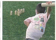
モルックに チャレンジ!